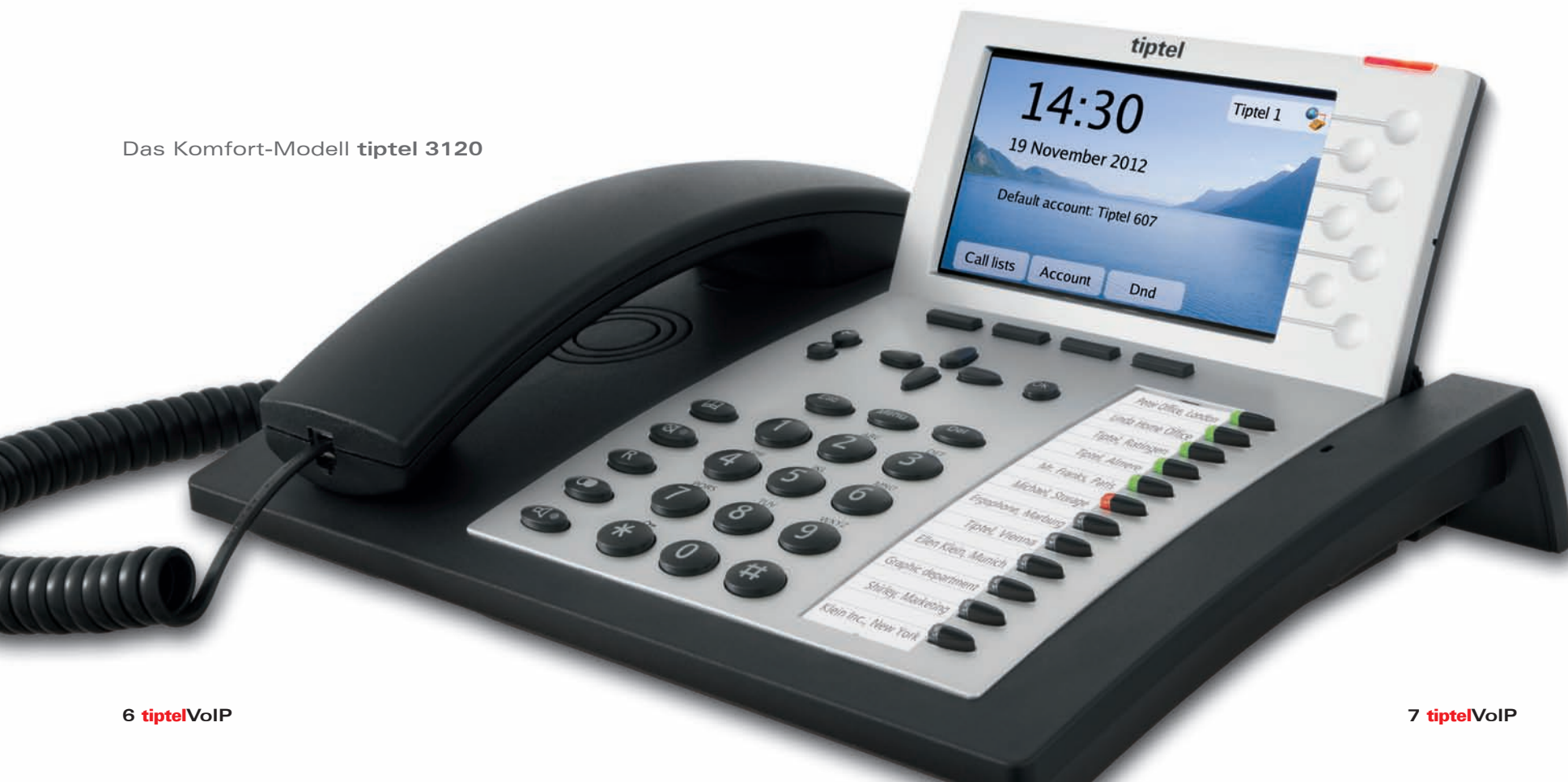
Das Komfort-Modell tiptel 3120

Die Menüführung ist dank 7 Sensortasten, 8 Steuertasten und 4 Softkeys mit Doppelbelegung einfach und übersichtlich. Das tiptel 3130 bietet zusätzlich eine Alpha-Tastatur, mit der Einträge aus dem Telefonbuch sicher und schnell abgerufen sowie ergänzt werden können. Alle Funktionstasten sind mit zweifarbigen Status-LEDs in rot und grün ausgestattet, so dass eine jeweils aktuelle Zustandsanzeige der jeweiligen Funktion gegeben ist.