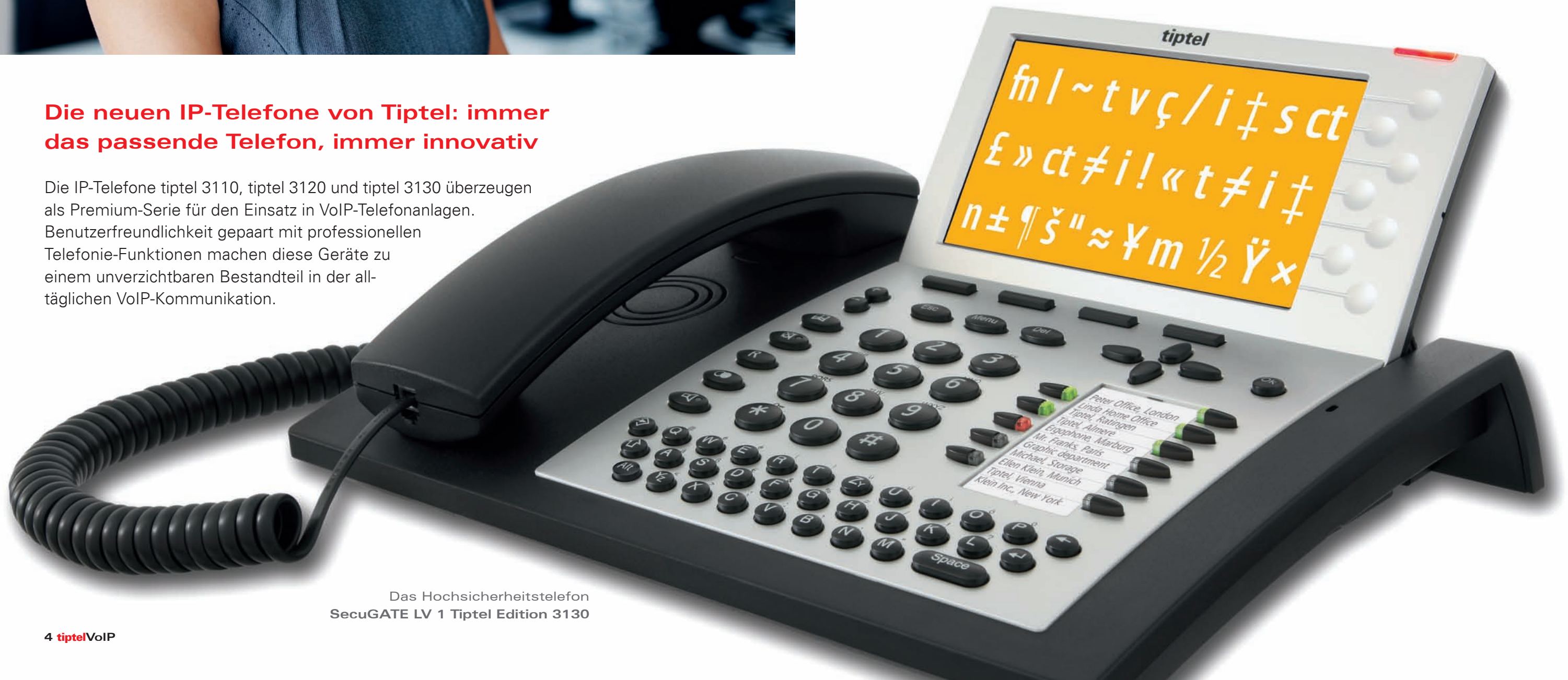
Das Hochsicherheitstelefon SecuGATE LV 1 Tiptel Edition 3130

Die IP-Telefone tiptel 3110, tiptel 3120 und tiptel 3130 überzeugen als Premium-Serie für den Einsatz in VoIP-Telefonanlagen. Benutzerfreundlichkeit gepaart mit professionellen Telefonie-Funktionen machen diese Geräte zu einem unverzichtbaren Bestandteil in der alltäglichen VoIP-Kommunikation.